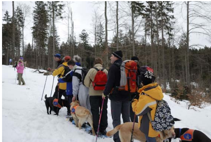
[Bild 9: Truppe von hinten, Hunde bereits zwischen den Menschen mitlaufend]

Bestens gestärkt, nehmen wir den letzten Abschnitt unserer Wanderung in Angriff. Irgendwann lassen auch bei den Hunden die Kräfte nach. Sie reihen sich in unserer Mitte ein und laufen ruhig in der Spur mit.