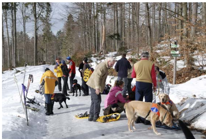
[Bild 3: Schneeschuhe anziehen auf dem Weg. Rechts geht es bergauf, links bergab, Schnee im Sonnenschein.]