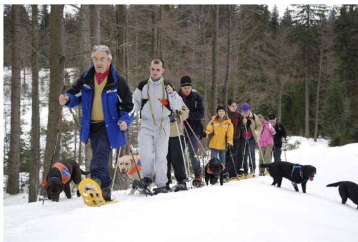
[Bild 8: Komplette Truppe von vorn am Waldrand, Hunde rechts und links tobend]

Die anderen Vierbeiner haben anscheinend - auch nach nun mehr als drei Stunden Bewegung im glitzernden Weiß - noch immer genug Energie und spielen ausgelassen im Tiefschnee.