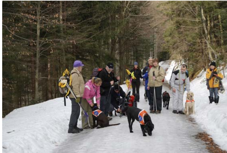
[Bild 2: Kurzer Halt unterwegs - alle stehen auf dem vereisten Waldweg – rechts und links tiefer Schnee]