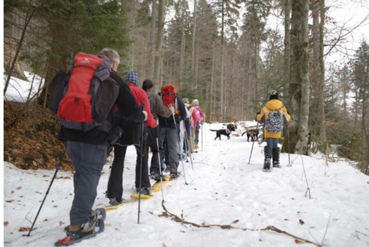
[Bild 5: Komplette Truppe von hinten auf Schneeschuhen mit Stöcken zwischen Bäumen, Hunde toben voraus.]

Solche Augenblicke möchte man einfach nur festhalten und in den oft doch ziemlich hektischen Alltag mitnehmen!